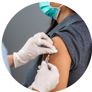
VACCINAZIONI IN FARMACIA a pagina 4

Affinché vengano applicate le relative riduzioni occorre obbligatoriamente compilare e riconsegnare il modulo di richiesta reperibile presso il Municipio, oppure scaricabile dal sito del Comune www.comune.la-thuile.ao.it . Sul sito sono anche disponibili maggiori informazioni riguardanti le varie aliquote.