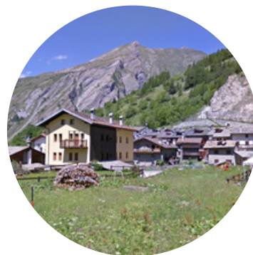
RESTYLING DEL THOVEX a pagina 11