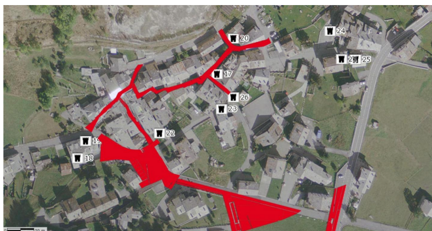
Figura 1 - Frazione Thovex nel comune di La Thuile con evidenziate le aree interessate dal progetto.

Nella seduta del Consiglio Comunale del 30 aprile 2021, è stato approvato il progetto preliminare di riqualificazione del Thovex. Si tratta di un progetto riguardante tutta una serie di interventi destinati al miglioramento funzionale ed estetico della frazione. I lavori di miglioramento e riqualificazione si svolgeranno in 4 lotti così suddivisi: un primo lotto si concentrerà sul miglioramento dell'area di raccolta rifiuti, dove si realizzeranno dei moloch a fianco dell'attuale fontana e saranno sistemati i parcheggi adiacenti. Il secondo lotto riguarderà la realizzazione di nuovi parcheggi, vista la carenza in zona, e di un marciapiede lungo la strada che, dall'incrocio con la Strada Regionale, conduce verso l'interno del Thovex. In un terzo momento, si procederà alla messa in sicurezza dell'attuale fermata della navetta sulla Strada Regionale e in una quarta fase, si provvederà alla riqualificazione delle stradine interne della frazione mediante il rifacimento dei sottoservizi e la realizzazione della pavimentazione. Il costo complessivo preventivato per la totalità di questi interventi è di 628.447,75 euro.