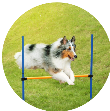
PERCORSO AGILITY DOG a pagina 7